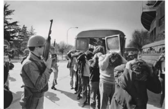
Chili, septembre 1973

Cette exposition rassemble des photographies couvrant la plupart des séries importantes de son œuvre, notamment ses prises de vue en Amérique Centrale, Chine et Afrique du Sud.