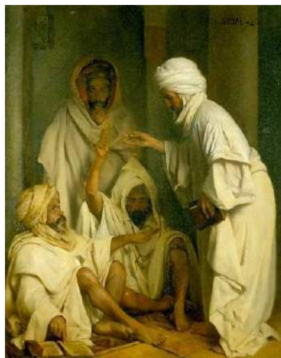
Eugène Vidal, Marabouts dans une mosquée de Constantine Huile sur toile ; 157 x 125 cm ; Achat de l'Etat, 184